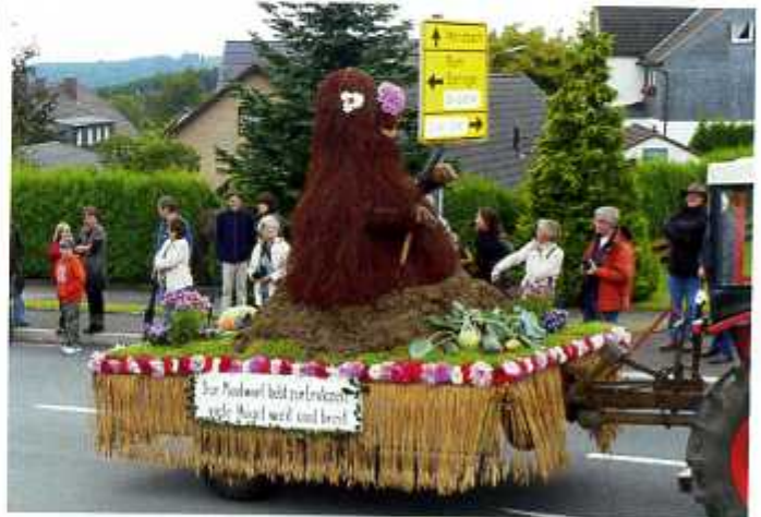
Ein überdimensionaler Maulwurf lugte beim Erntefestzug in Lichtenberg aus seinem Hügel hervor.

Zum fünften Mal hatte der Treckerclub Lichtenberg ein Treffen ausgerichtet, und der Altar der Pfarrkirche Lichtenberg war wieder festlich geschmückt worden. Der MGV „Hoffnung“ Lichtenberg hatte das Erntedankfest mit einem Freundschaftssingen zum 105jährigen bestehen eingeläutet. Eine Toten- und Gefallenenehrung, ein Festgottesdienst im Zelt, eine Mega-Fete mit den „Partyvögeln“ sowie ein musikalischer Frühschoppen mit Kinderbelustigung rundeten das Erntedankfest ab. Weitere Fotos vom Erntefestzug in Lichtenberg finden Sie unter www.morsbach.de .